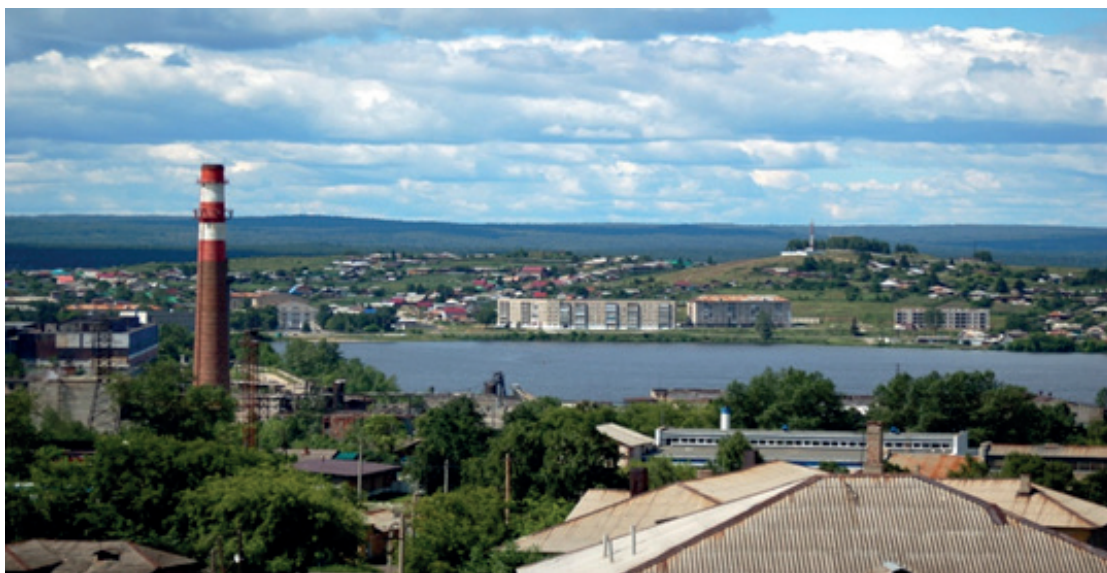
Фото №1 г. Верхний Уфалей

Ляшенко Е.Н. Литературно-краеведческий материал в музыкальном воспитании детей дошкольного возраста// Образовательный альманах №4(92) от 15.04.2025 URL: https://f.almanah.su/2025/92.pdf