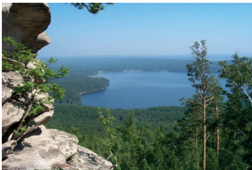
Фото №4 Окрестности г. Верхний Уфалей, озеро Аракуль