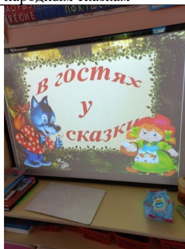
Презентация «В гостях у сказки»