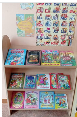
Книжный уголок по русским народным сказкам