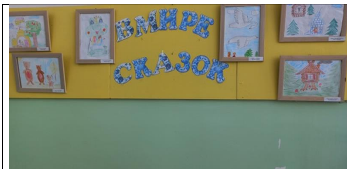
«В гостях у сказки» Совместное творчество родителей и детей