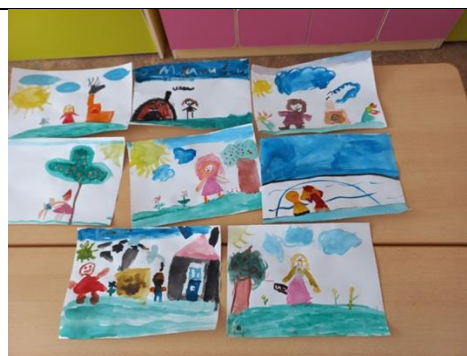
Рисование «Моя любимая сказка»