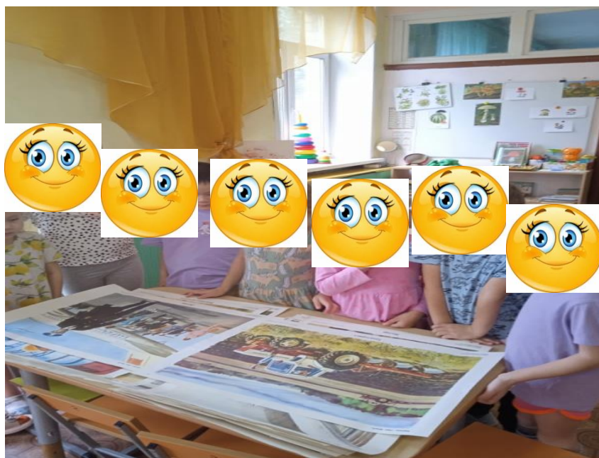
Рисунки и раскрасок по профессиям.