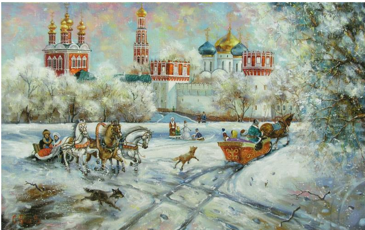
Сергей Боев «Воскресные гулянья у Новодевичьего»