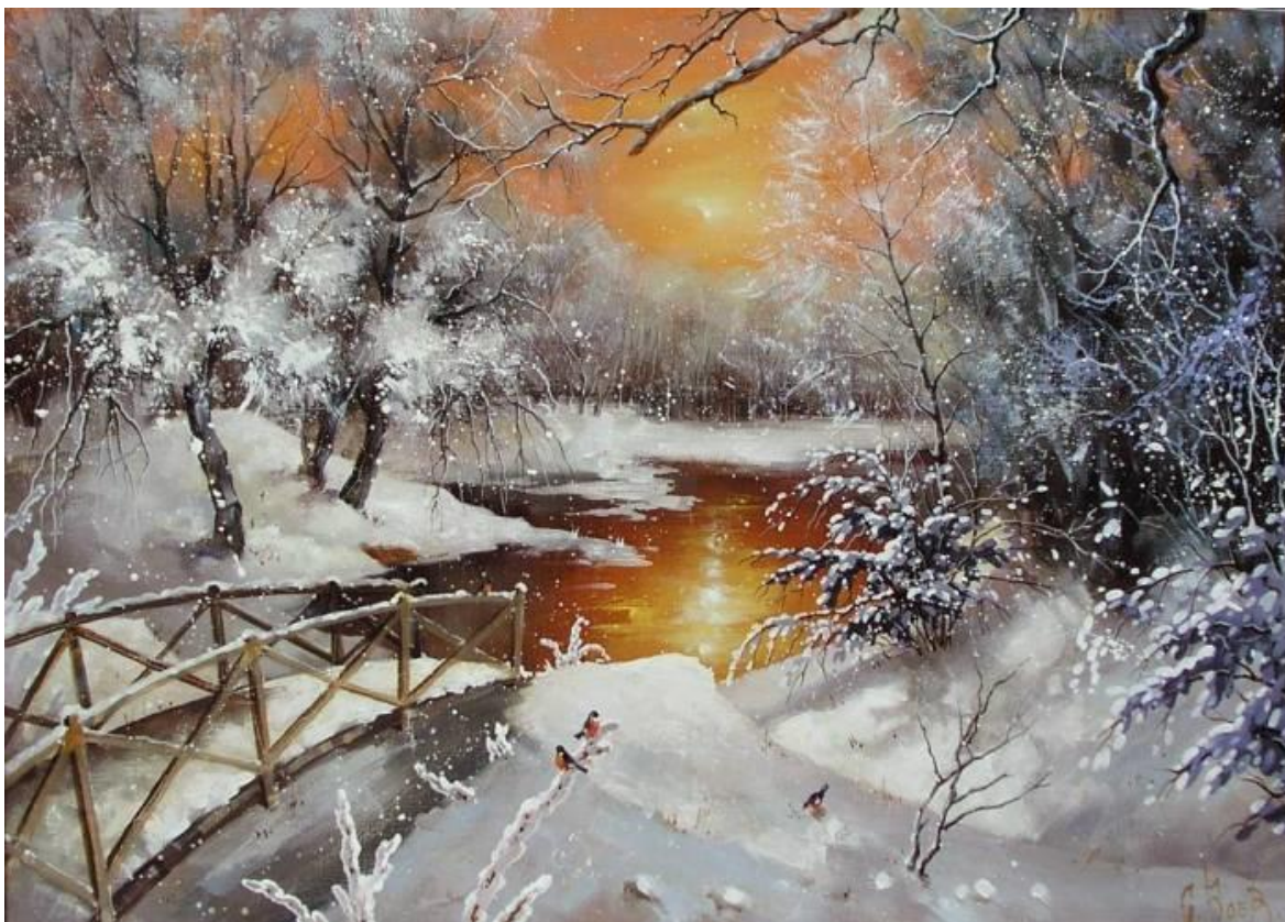
Сергей Боев «Сказочный пейзаж»