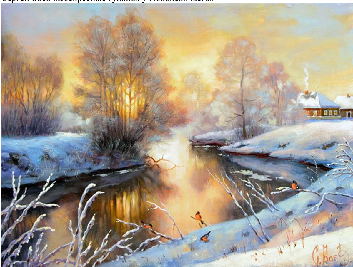
Сергей Боев «Морозное утро»