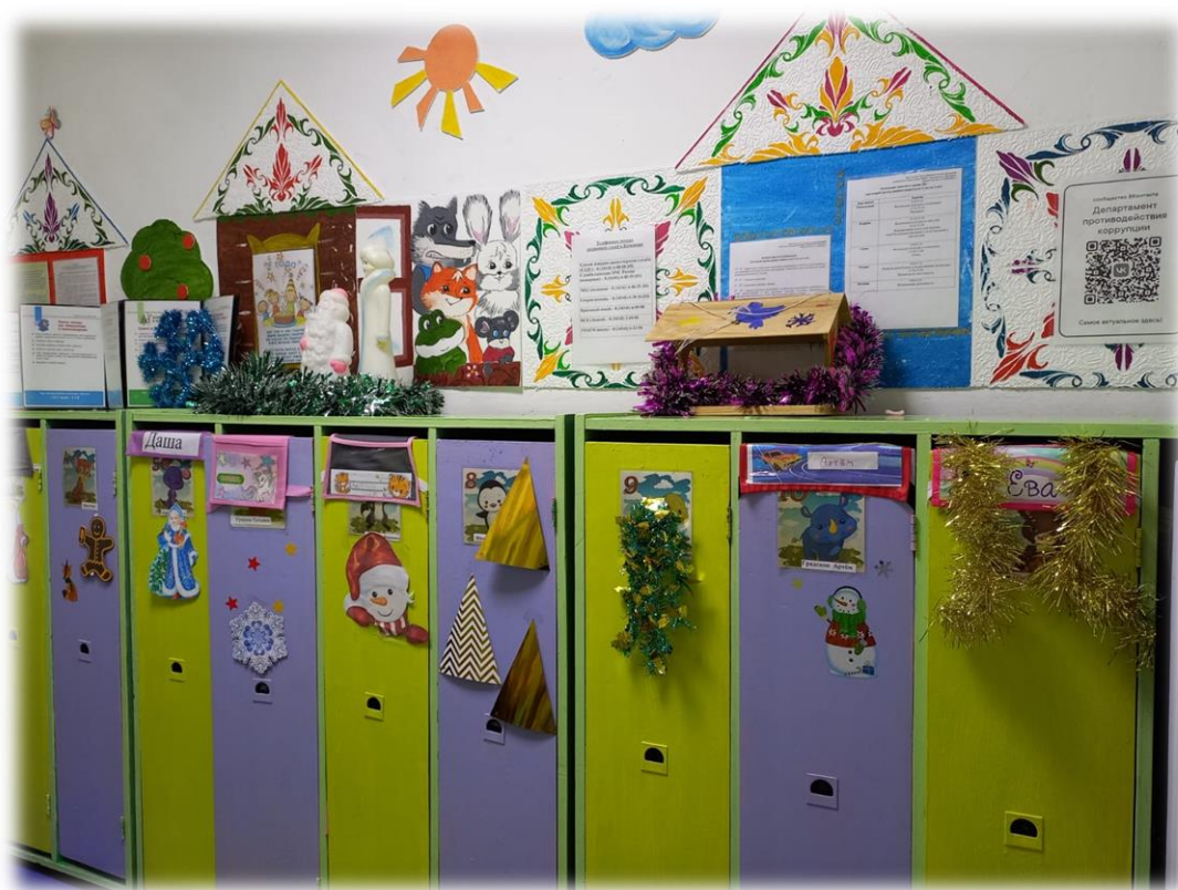
Украшение группы к Новому году