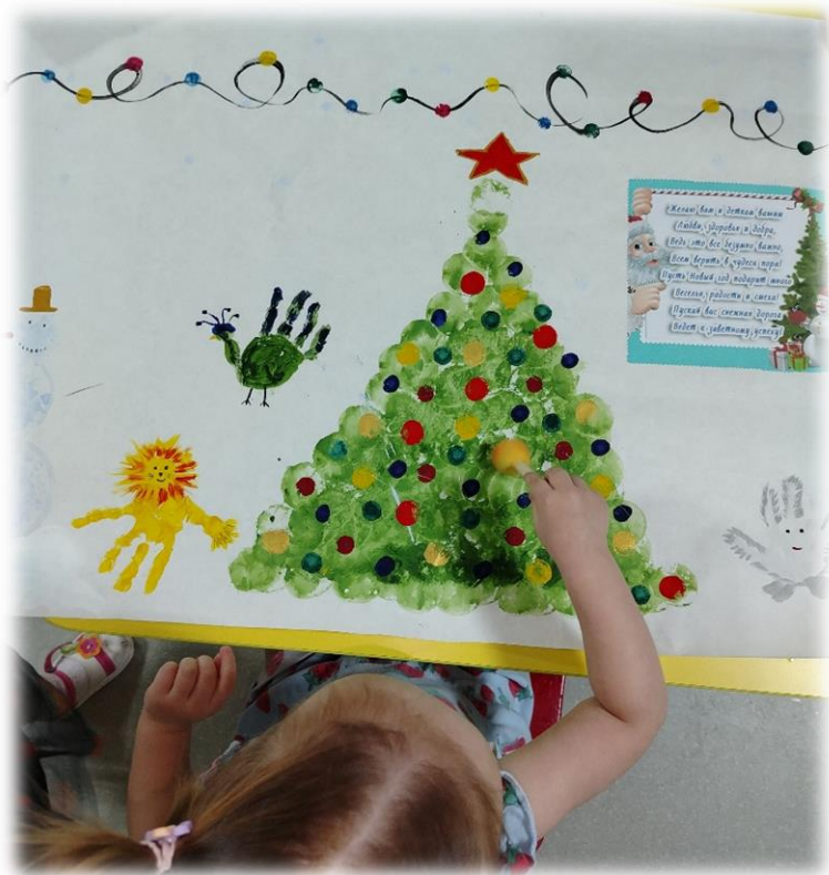
Семейное творчество «Новогодняя игрушка», украшение шкафчиков.