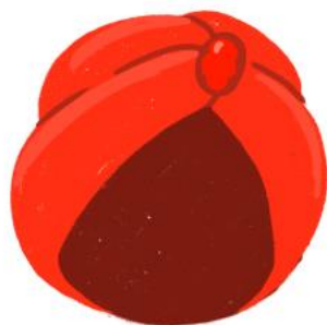
Эмоционально- интуитивное мышление