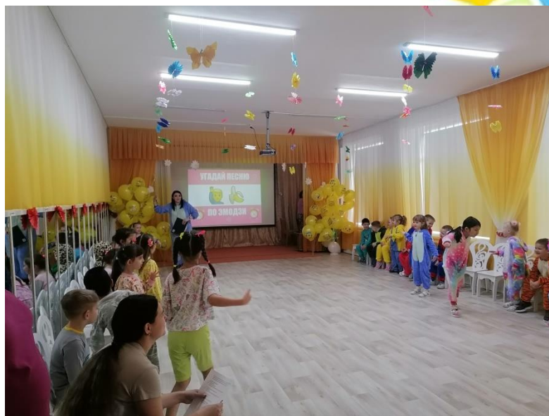
Сценка от воспитанников старшей группы