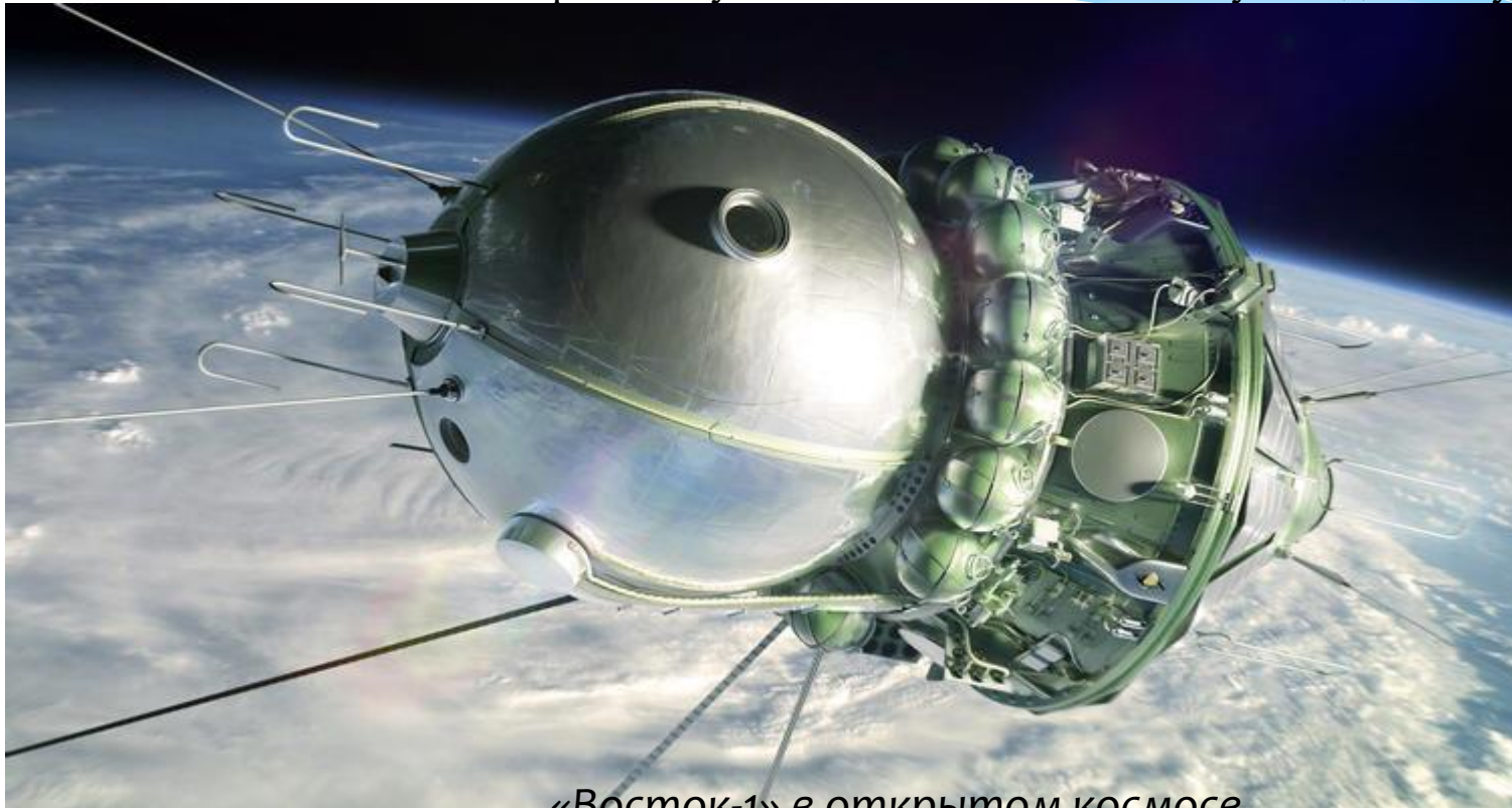
«Восток-1» в открытом космосе (художественное изображение)

При конструировании «Востока» было придумано несколько простых, но весьма эффективных решений, которые потом использовались и на других космических ракетах. Сделать некоторые вещи в срок не получилось, и, например, по этой причине было принято решение не вставлять сюда систему аварийного спасения при старте. Вдобавок ко всему из конструкции уже строящегося корабля удалили вторую тормозную систему, дублирующую первую. Отказ от неё обосновали тем, что «Востока-1», войдя на не слишком высокую орбиту (до 200 километров), всё равно в течение десяти суток слетел бы с неё из-за торможения о высшие атмосферные слои и возвратился бы обратно на нашу планету. И систем жизнеобеспечения на корабле-спутнике тоже хватало максимум на десять суток.