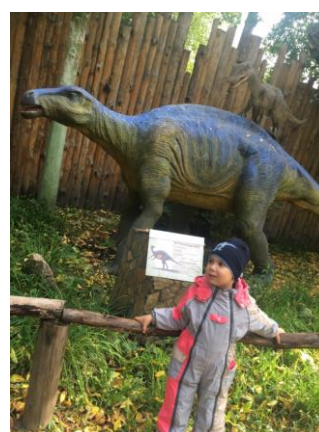
Рисунок 2. Дино-парк, Стегозавр и Игуанодонт.