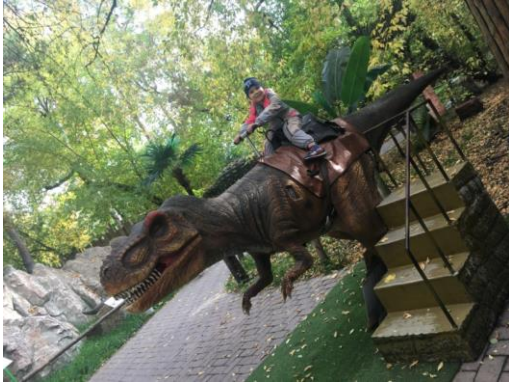
Рисунок 3. Поездка на Тираннозавре.

В конце тропинки есть фотозона с огромными яйцами динозавров. Кроме этого, есть динозавры, которых можно оседлать, как лошадь, и «прокатиться» в течение пары минут. Чем мы и воспользовались (рис.3).