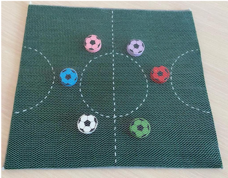
Игра «Наряди краба»