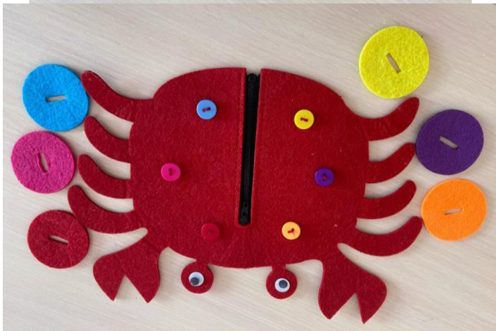
Замочки – застежки