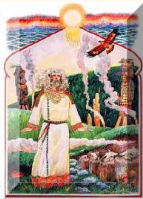
Бог солнца Хорос