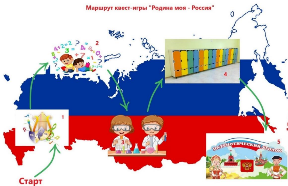
Маршрут квест-игры "Родина моя - Россия"