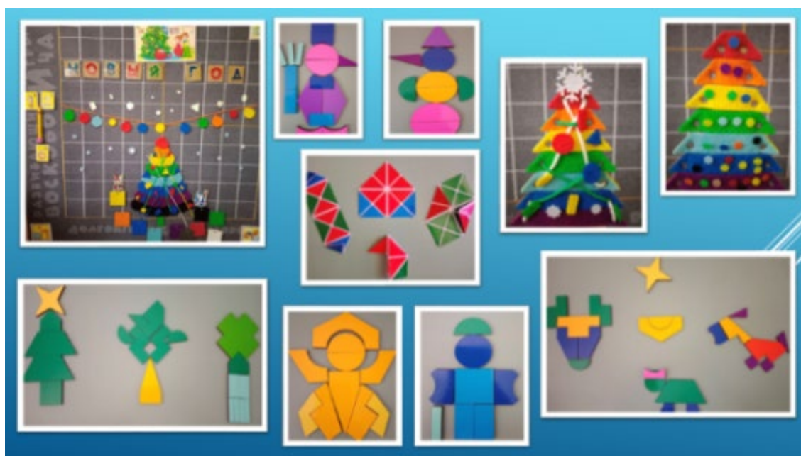
Рис. 1. Рождество

Рождество. Знакомя с православным праздником Рождество, воспитатели рассказывают детям почему Рождественская ёлка - традиционный атрибут празднования Рождества, что первыми о Рождении Христа узнали и разнесли по всему свету ангелы, рассказали о животных, которых были рядом с родившимся младенцем. Все эти истории были выложены из конструктора «Чудо-соты», «Чудо-крестики 1», «Чудо-крестики 2», «Чудо-крестики 3». Дети с интересом включались в силуэтное конструирование (рис. 1).