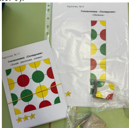
Методический материал игры-головоломки «Складушки» (Рис. 1)

Для организации игры понадобится методический материал. Ребенку необходимо накладывать квадратики на игровое поле или собрать рядом на столе, глядя на образец (Рис. 1).