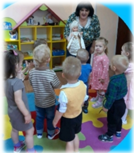
Рассматривание одежды Русской красавицы