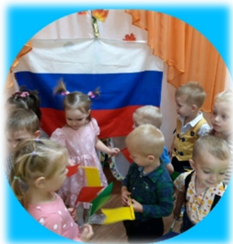
Беседа «Российский флаг»