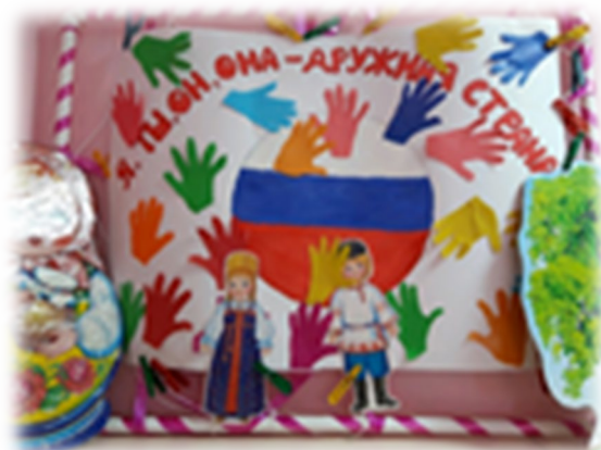
Выполнение коллективной работы