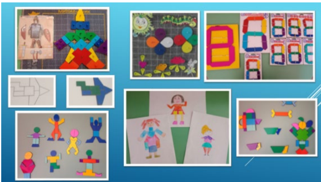
Рис. 2. 8 марта

крестиков» не только можно конструировать, но и рисовать, если обвести деталь по контуру и раскрасить ее. Таким способом дети рисовали маму модницу (рис.2).