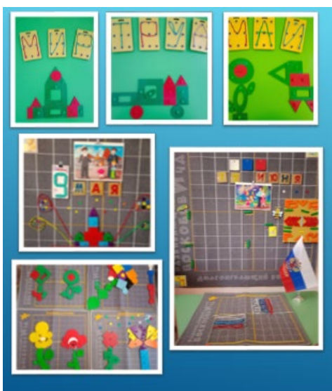
Рис. 4. День России

12 Июня - День России этот праздник также традиционно празднуется в нашем детском саду. У нашей страны, как и у всякого уважающего себя государства, есть свои государственные символы. Это флаг, герб и гимн. С помощью «Умных стрелочек», «Разноцветных липучек» дети выполняли графический диктант, создавали флаг, тем самым закрепляли знания о символике российского государства (рис.4).