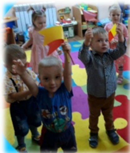
Разминка с флажками «Разноцветные флажки»