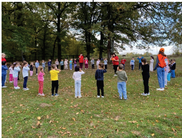
Фото 1 Приветствие