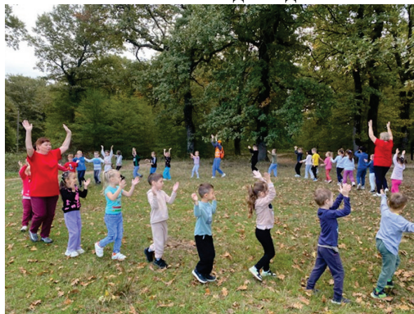
Фото 2 В поход пойдем