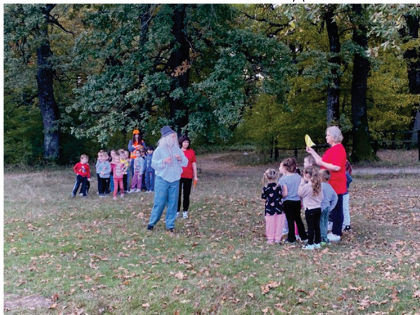
Фото 3 Листопад