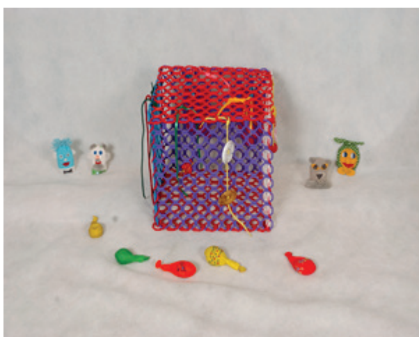
« Сенсорный куб »

Цель данного пособия: развивать сенсорные способности, речь, внимание, воображение, мелкую моторику; формировать дифференцированное восприятие качества предметов.