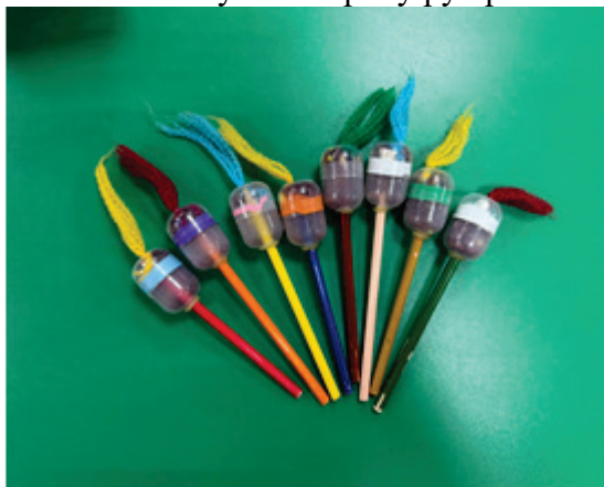
« Весёлые карандашики » Способствуют овладению тонкими движениями пальцев.

Развивать мелкую моторику рук ребятам помогают: