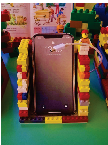
рис. 3 подставка для телефона из LEGO