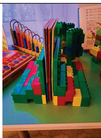
рис. 4 держатель для книг из LEGO