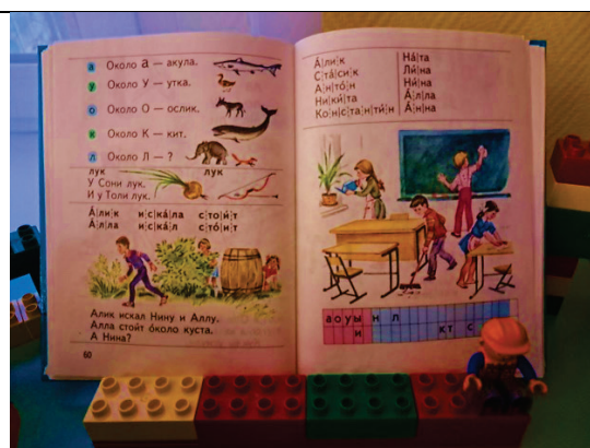
рис. 2 Подставка для книг из LEGO