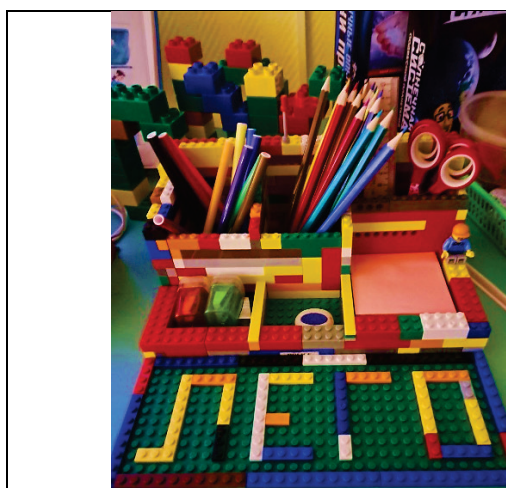
рис. 1 Органайзер из LEGO

В контексте развития творческого потенциала детей дошкольного возраста, целесообразным представляется использование LEGO-конструкторов не только в традиционных игровых формах, но и в качестве инструмента для создания моделей и макетов, отражающих элементы окружающей среды или профессиональной деятельности. Например, проектирование и конструирование рабочего места школьника из LEGO-деталей (см. рис. 1 – 4) в подготовительной группе способствует развитию пространственного мышления, воображения и представлений о функциональном назначении предметов. Такой нетрадиционный подход стимулирует творческую инициативу и позволяет реализовывать индивидуальные и коллективные творческие замыслы, расширяя предметно-развивающую среду группы и создавая условия для многоаспектного развития ребенка.