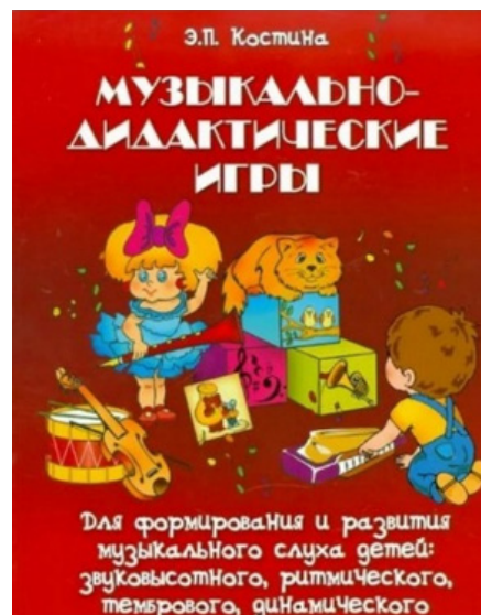
Рис. 3. Э. П. Костина «Музыкально-дидактические игры»

гое слово по слогам («та-та», «ти- та- та»), а играет ритм на металлофоне или на шумовых инструментах. (Игра «Сыграй-ка», «Ритмические кубики», «Сложи словечко», «Весёлый бубен»). Книга «Музыкально-дидактические игры» Э. П. Костиной представляет собой ценный ресурс для специалистов, работающих над развитием речи дошкольников. В пособии предложены разнообразные игровые задания, сопровождающиеся яркими иллюстрациями, что способствует вовлеченности ребенка в процесс обучения и улучшает восприятия.