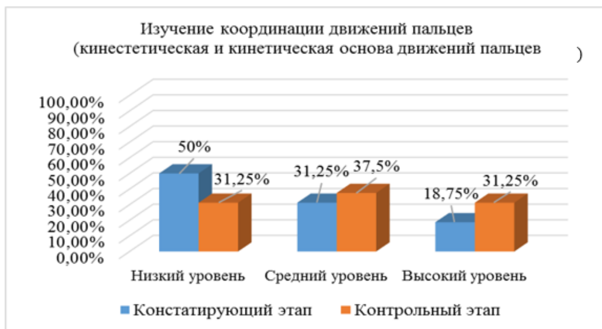
Рисунок 1. Результаты изучения координации движений пальцев в сравнении констатирующего и контрольного этапов эксперимента

моторики снизилось на 12,5%; количество детей со средним уровнем развития мелкой моторики увеличилось на 12,5%. В ходе выполнения упражнения «Собери изюм в мисочку/кубики в коробку» были получены следующие результаты: 37,5% (6 человек) с низким уровнем развития мелкой моторики; 43,75% (7 человек) и 18,75% (3 человека) со средним и высоким уровнями развития мелкой моторики. При сравнении результатов констатирующего и контрольного этапов эксперимента были получены следующие данные: количество детей с низким уровнем развития мелкой моторики снизилось на 18,75%, количество детей со средним уровнем развития мелкой моторики повысилось на 12,5%; количество детей с высоким уровнем развития мелкой моторики увеличилось на 6,25%.